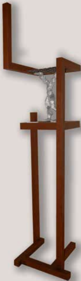
SOPORTANT LA REIXA. Acer i alumini, 227x70x61 cm.