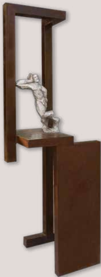
DESCANS EN LA PORTA. Acer i alumini, 221x74x61 cm.