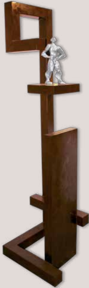
ESPECTANT. Acer i alumini, 193x56x55 cm.