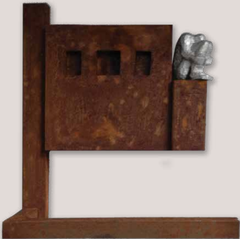
MEDITACIÓ AMB FINESTRES. Acer i polièster, 55x51x23 cm.