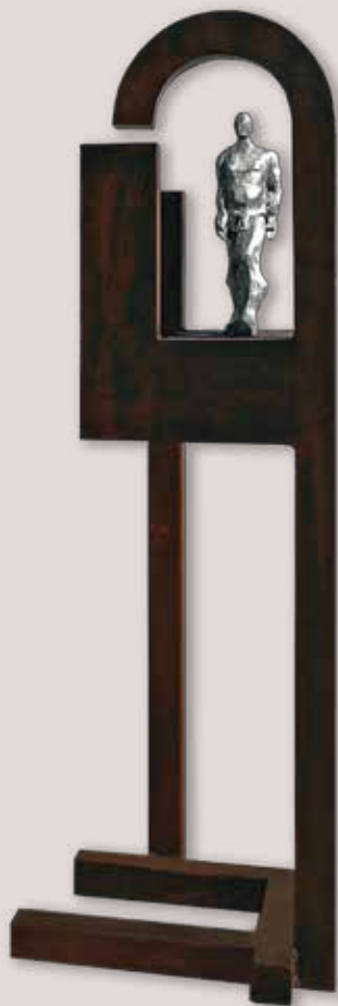
PER L'ARC. Acer i alumini, 210x52x49 cm.