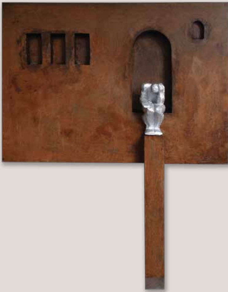
PROJECCIÓ DEL PENSAMENT. Acer i polièster, 88x70x12 cm.