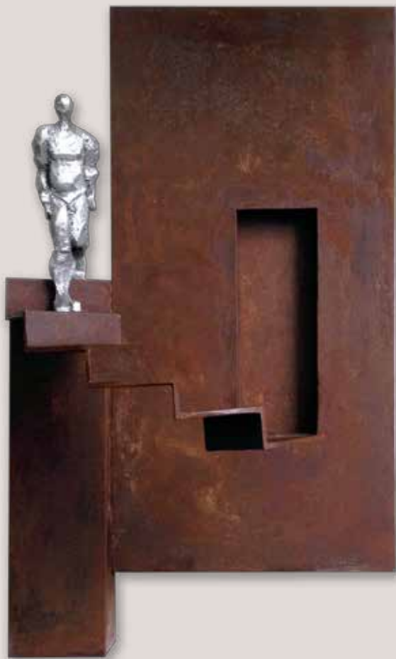
DE TORNADA. Acer i polièster, 66x40x28 cm.