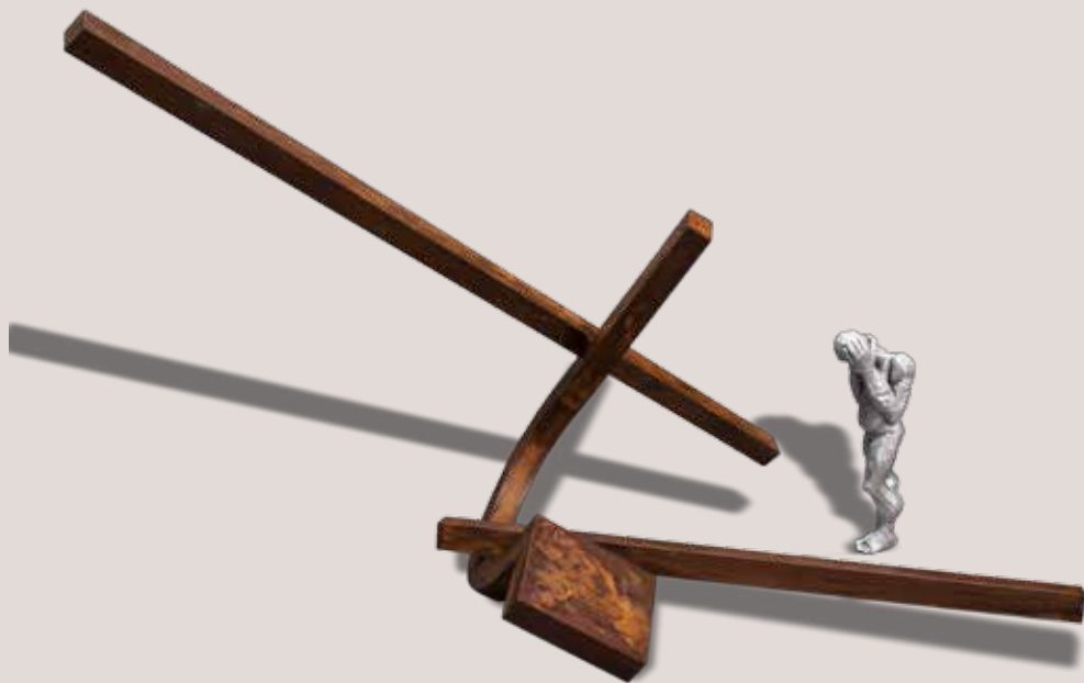
REFLEXIU. Acer i alumini, 129x211x114 cm.