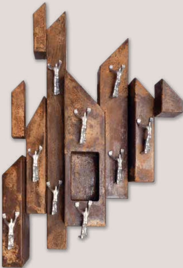
CIUTAT-6. Acer i alumini, 51x34x12 cm.