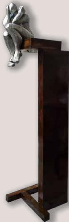
REFLEXIU-2. Acer i alumini, 218x54x49 cm.