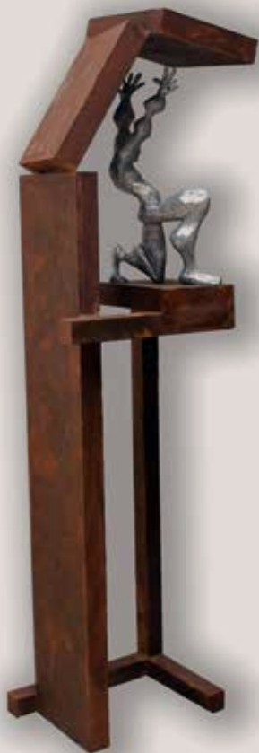
PROTEGINT-SE. Acer i alumini, 198x52x42 cm.