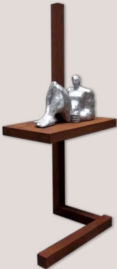
RELAXACIÓ. Acer i alumini, 184x55x82 cm.