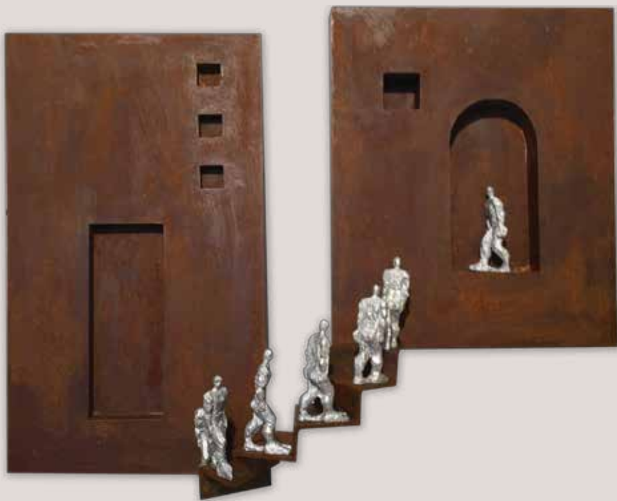
FLUIDESAS. Acer i poliëster, 75x94x23 cm.