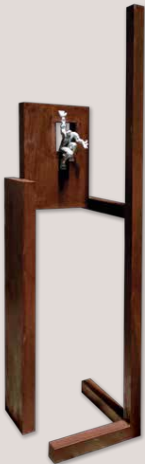
EIXINT DE LA FINESTRA. Acer i alumini, 191x52x44 cm.