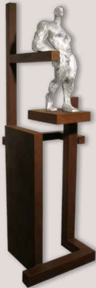
DESCSANS. Acer i alumini, 195x66x65 cm.