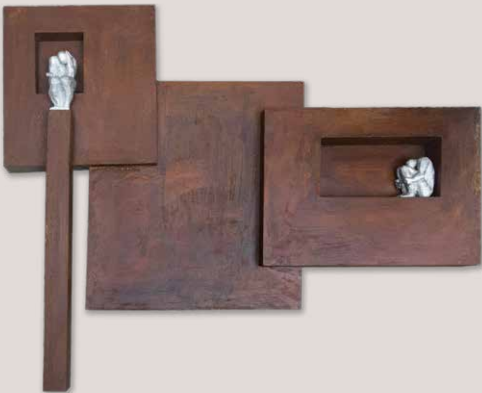
DUALITATS REFLEXIVES. Acer i polièster, 110x131x12 cm.