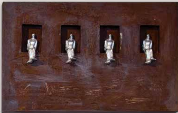
OBSERVANT PER LES FINESTRES. Acer i polièster, 45x30x10 cm.