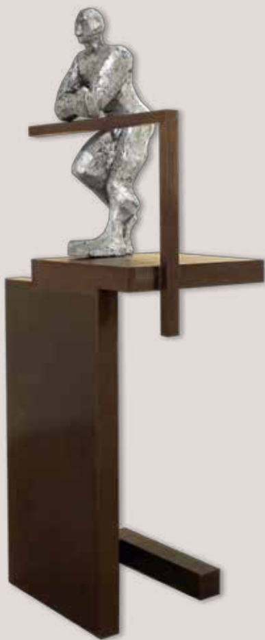
AL BALCÓ. Acer i alumini, 185x64x47 cm.