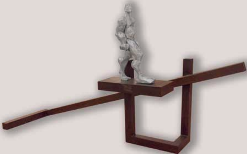
FENT CAMÍ. Acer i alumini, 110x205x50 cm.