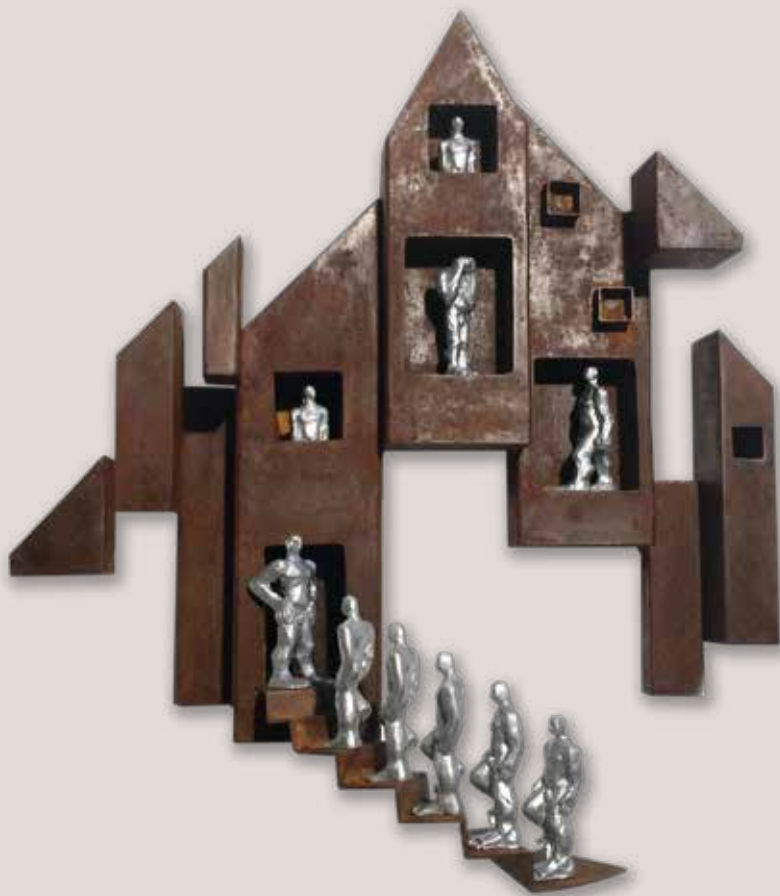
CIUTAT-4. Acer i polièster, 56x51x20 cm.