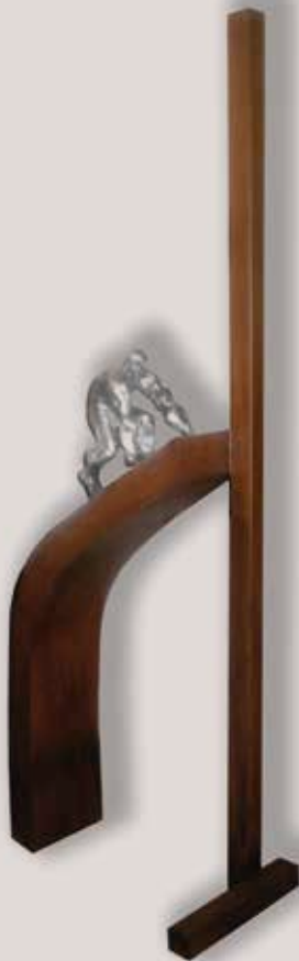
DIFICULTATS. Acer i alumini, 204x70x40 cm.