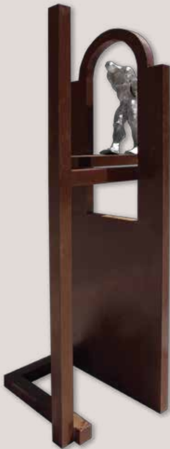
PASSADÍ'S. Acer i alumini, 233x60x60 cm.