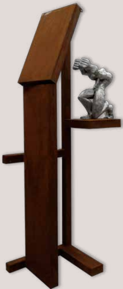
TOMBANT EL MUR. Acer i alumini, 227x87x46 cm.