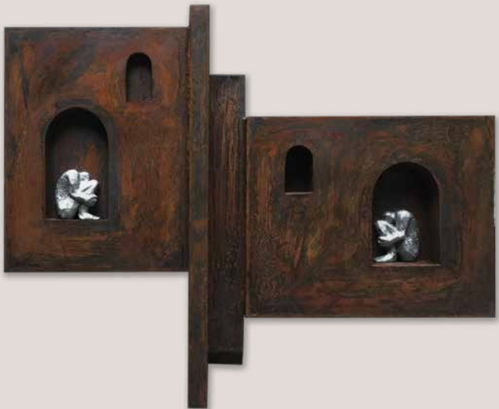
PENSAMENTS OPOSTOS. Acer i polièster, 79x103x10 cm.