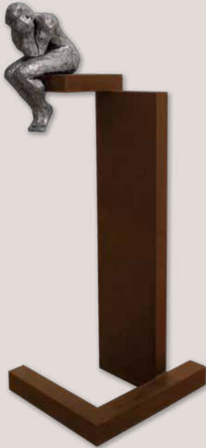
REFLEXIU. Acer i alumini, 201x50x46 cm.