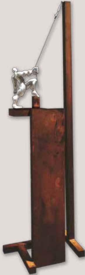
A TOMBAR-HO. Acer i alumini, 225x68x50 cm.