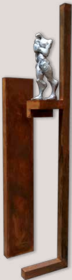
EN SI MATEIX. Acer i alumini, 193x41x31 cm.