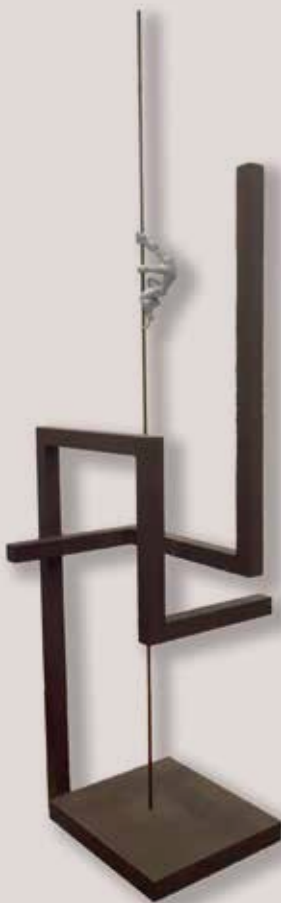
PUJANT A LES FINESTRES. Acer i polièster, 186x49x44 cm.