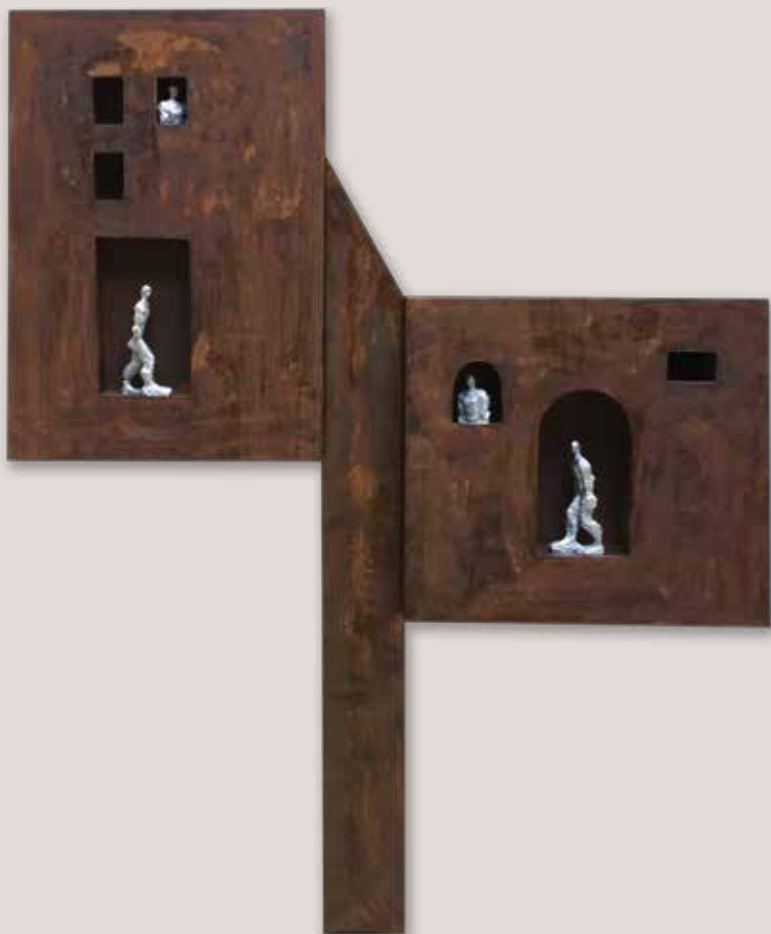
CONTRAPOSICIONS. Acer i polièster, 117x94x14 cm.