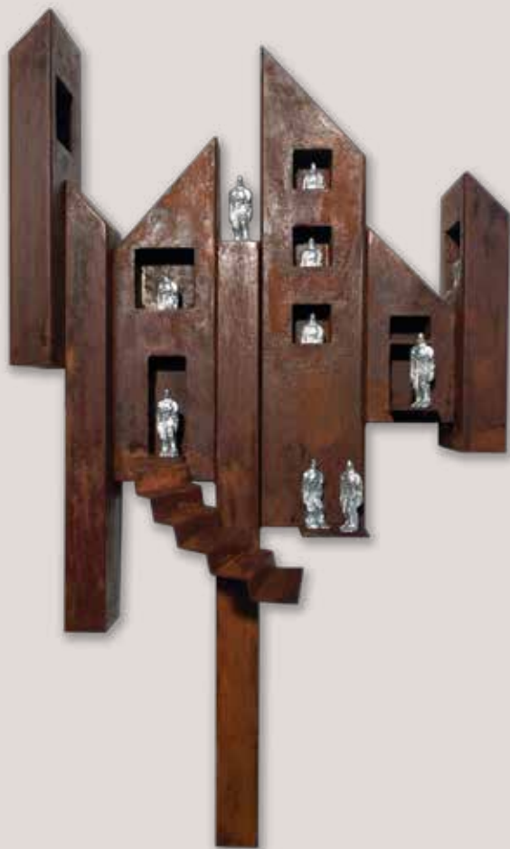
CIUTAT-3. Acer i polièster, 75x44x21 cm.