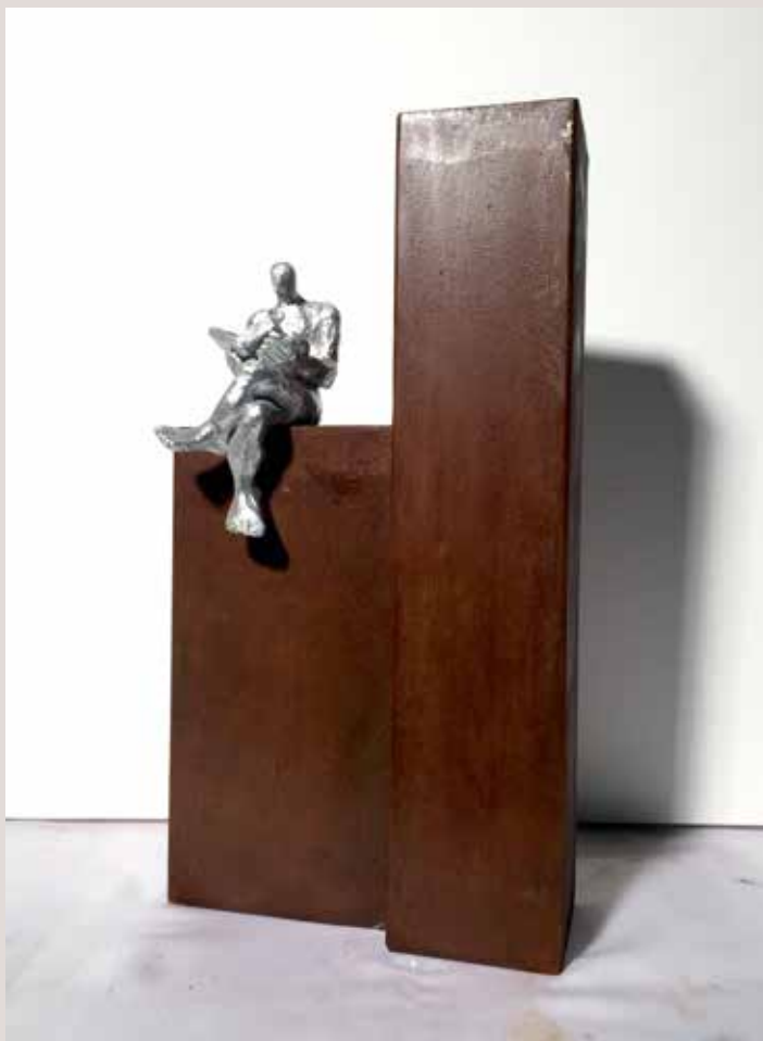
FUTUR INCERT. Acer i poliëster, 38x21x11 cm.