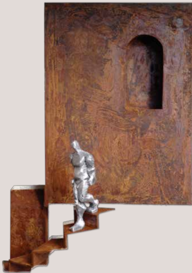
CAP AVALL. Acer i polièster, 67x48x22 cm.