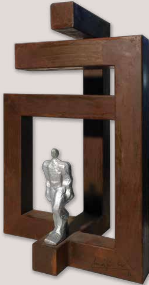
EIXINT DEL CAOS. Acer i polièster, 44x29x23 cm.