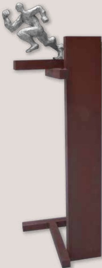
A PER ELLS. Acer i alumini, 190x60x65 cm.