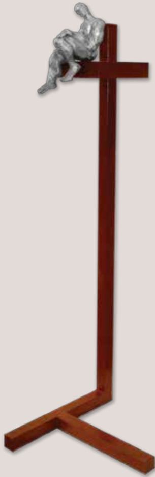
AMB ELL MATEIX. Acer i alumini, 127x41x39 cm.